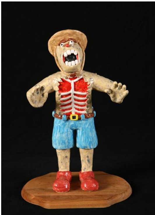
“Ralph the Rodeo Clown” Escultura/Diseño en 3d Mark Lynaugh 12º Grado MENCIÓN HONORABLE